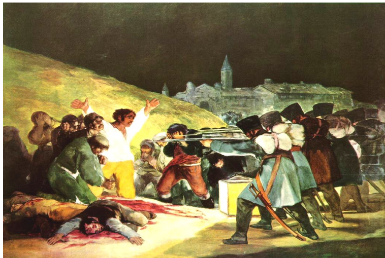
Goya O Três de Maio

Título do original francês: “Procès des Spiritistes”